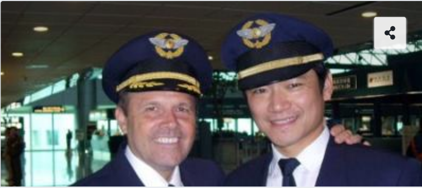
Airbus AF447 Rio-Paris et incident/accident Eva Air – Norbert Jacquet