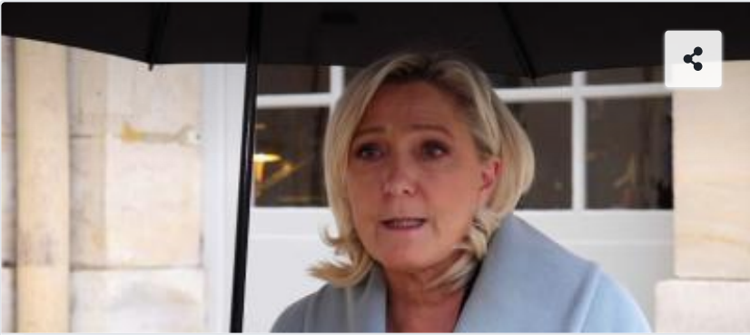
Pour Marine Le Pen, Emmanuel Macron a un « choix » entre référendum, dis...