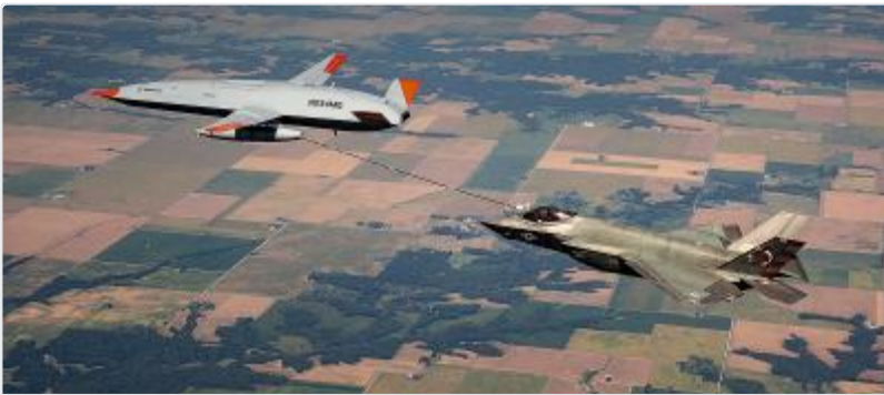
Boeing MQ-25 Stingray — Wikipédia