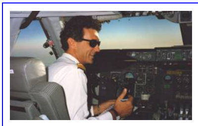
Le Web général